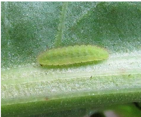
← Chenille du cuivré des marais.

Le Cuivré des marais est un petit papillon présentant des variations entre les sexes.