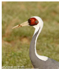
Grue à cou blanc